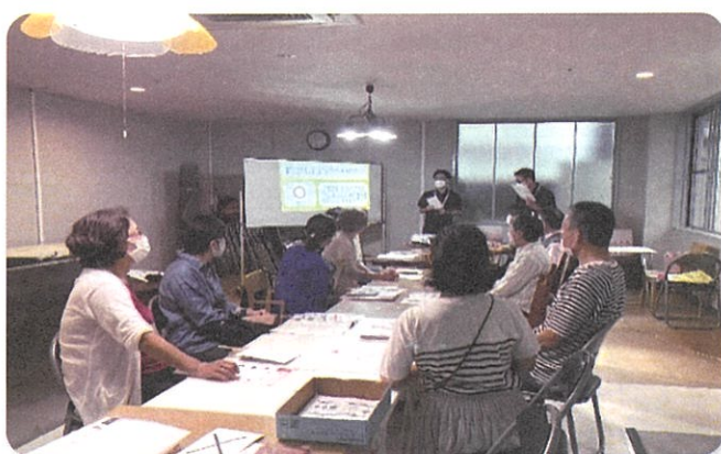
毎月1回勉強会を開催しています！

もともとちょっとした困りごと支援をされていたのですが、活動を見直し、住民主体型生活支援訪問サービスとして活動することで、地域包括支援センターや区社協との関わりも増えました。これからも相談者の気持ちに寄り添った支援を目指します。