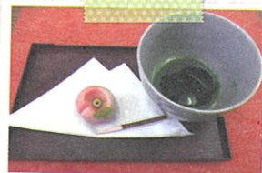
目にも美味しい抹茶と和菓子

笑福カフェは毎月第3日曜日に開催しています。お茶やコーヒーを飲みながら、折り紙や塗り絵をしたり、相談を受け付けている「カフェタイム」、ゲストを招いて演奏や講演を聴く「お楽しみタイム」を設けています。今回は音楽療法士の方をお招きして、歌を歌ったり、ゆったりと体を動かしたり、楽しく穏やかな時間を過ごしました。