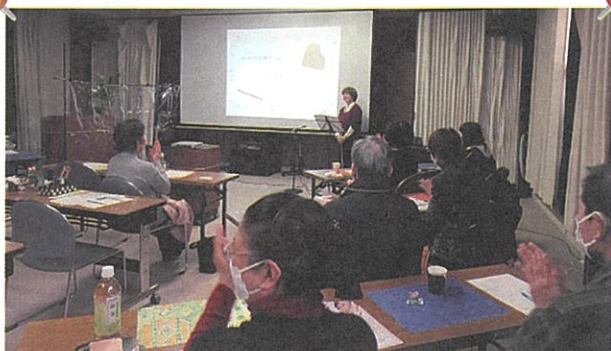
音楽療法士の方による心安らぐフルートの演奏♪

令和5年1月15日(日)午後、山田地区集会所で笑福カフェが開かれ、約30人が参加されました。