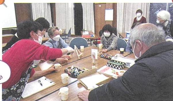
和やかな雰囲気での話し合い!