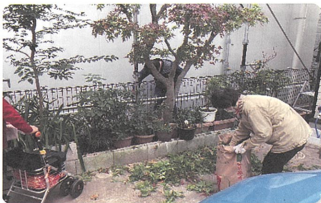
依頼者と談笑しながら活動します！

そして、「ふれあいサービスもちもちの木」では、勉強会を開催しています。皆さんで活動報告や依頼相談や会の運営について話し合わせ、一歩ずつ進めています。